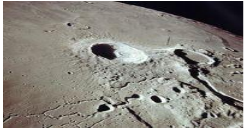
Riccioli , 17. století